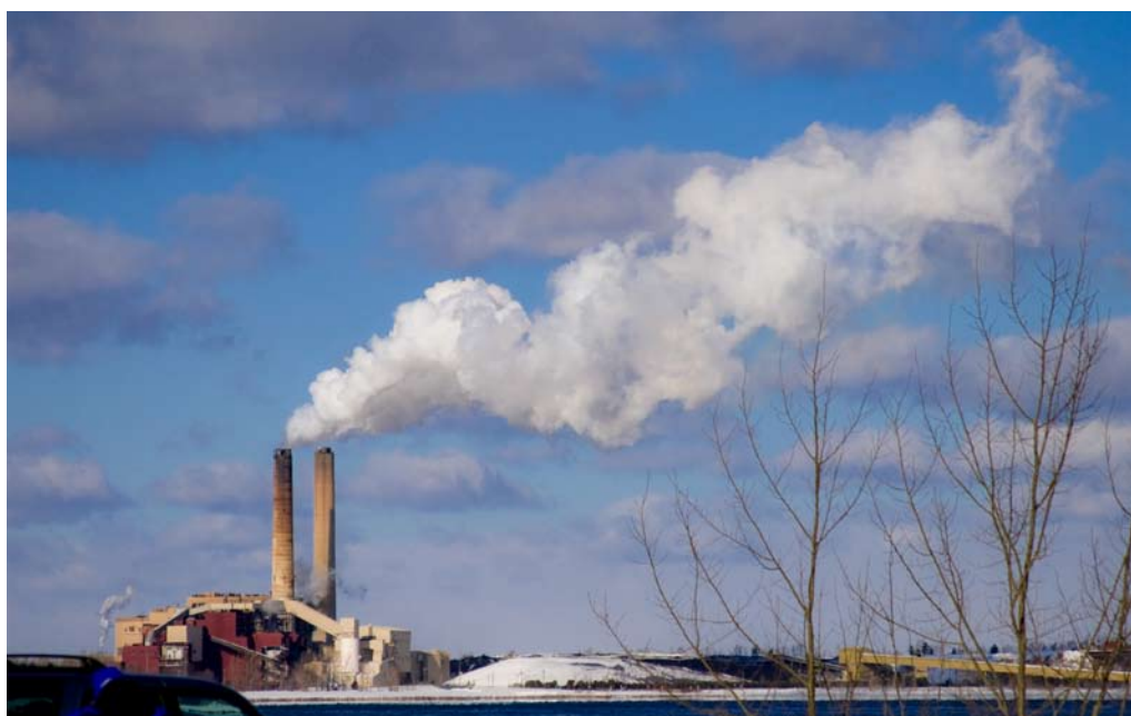
Podarí sa znížiť do roku 2020 emisie o 20%?