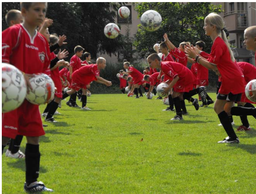
Tréning mladých nadšencov futbalu, ktorí sa zapojili do projektu Rodinný futbal.

pozitívneho po športovej i spoločenskej stránke. Zhruba piati mladíci sa na základe výkonnosti v kempe zapojili do tréningového procesu v Spartaku, čo je pre výchovu mladých nádejí pozitívna správa. Kemp sa niesol v duchu projektu Rodinný futbal, ktorý ZSE spustila v apríli 2010. Organizátori sa tiež rozhodli darovať pobyt na kempe dvom deťom zo sociálne slabších rodín a jednému dieťaťu z detského domova v Trnave.