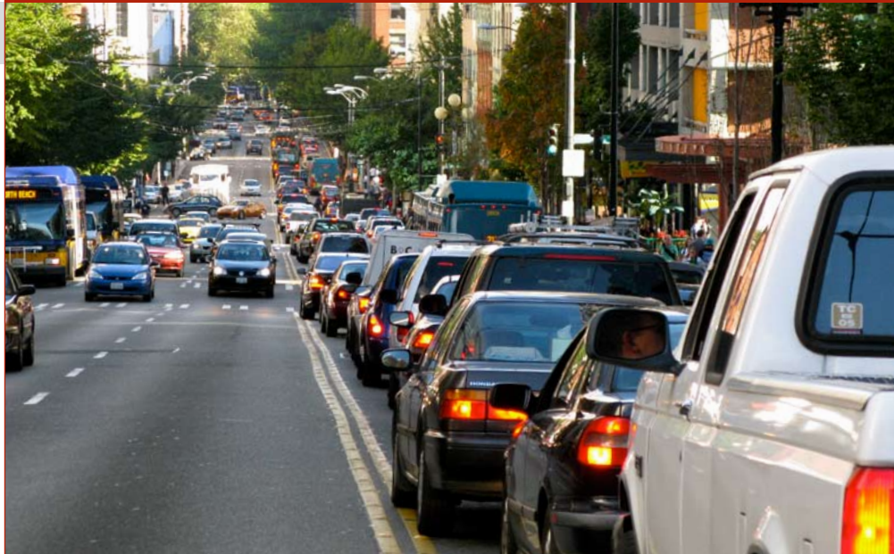
Európsky týždeň mobility – pomôže odstrániť zápchy v meste?