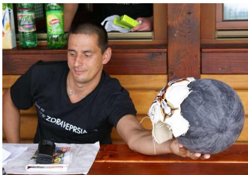
Takto skončila lopta po divokom futbalovom zápase chlapcov vo Vyšných Ružbachoch.

Do zbierky prispievali aj individuálni darcovia prostredníctvom darovacieho portálu www.DobraKrajina.sk , ktorý v novembri minulého roka spustila Nadácia Pontis.