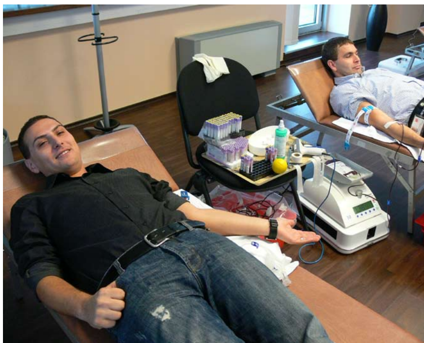
Niektorí zamestnanci si počas odberu krvi aj pospali, iní monitorovali situáciu s úsmevom.