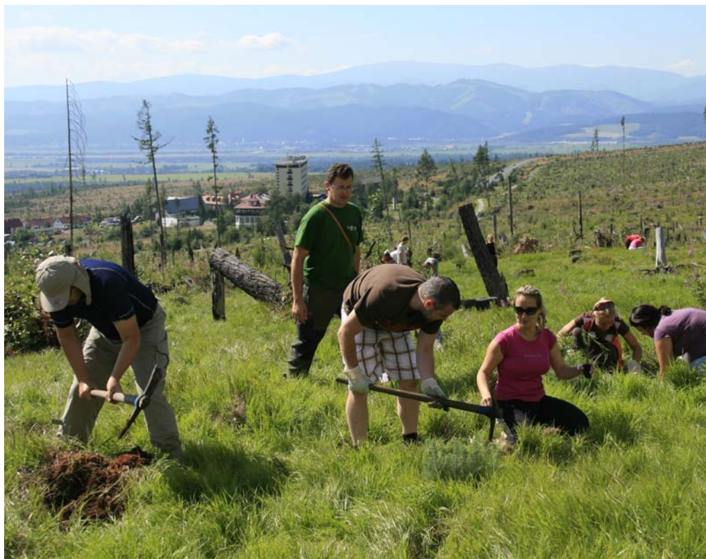
Práca bola určite fyzicky náročnejšia ako v kancelárii.